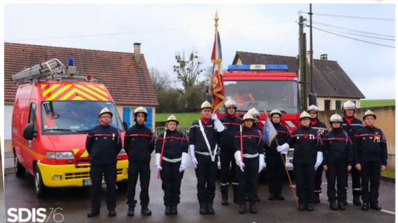
La Compagnie de Sapeurs Pompiers de Gaillfontaine