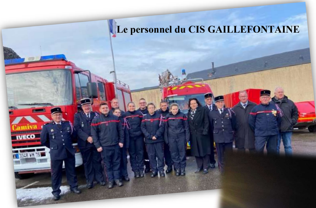
Le personnel du CIS GAILLEFONTAINE