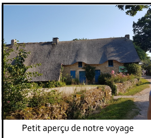
Petit aperçu de notre voyage

Début juillet certains d'entre nous ont profité du voyage des pompiers vers Guérande St Nazaire sous le soleil et la chaleur ce qui a contribué à la parfaite réussite de ce voyage toujours bien organisé. Fidèles à nos traditions nous terminons l'année en nous réunissant autour des tables à la cantine devant un succulent repas toujours dans la bonne humeur et convivialité valeur si importante dans la vie actuelle. Un grand merci au service de la cantine.