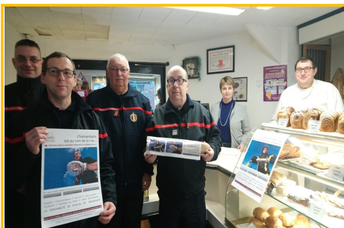
En collaboration avec nos commerçants, le centre d'incendie et de secours a lancé une campagne de recrutement.

Merci à l'Amicale qui nous permet d'entretenir ces relations humaines au travers d'activités et de moments de convivialité.