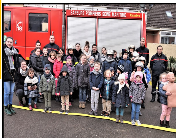
Le centre de loisirs reçu par les sapeurs pompiers de GAILLEFONTAINE pour découvrir la caserne, ces véhicules et le matériel.